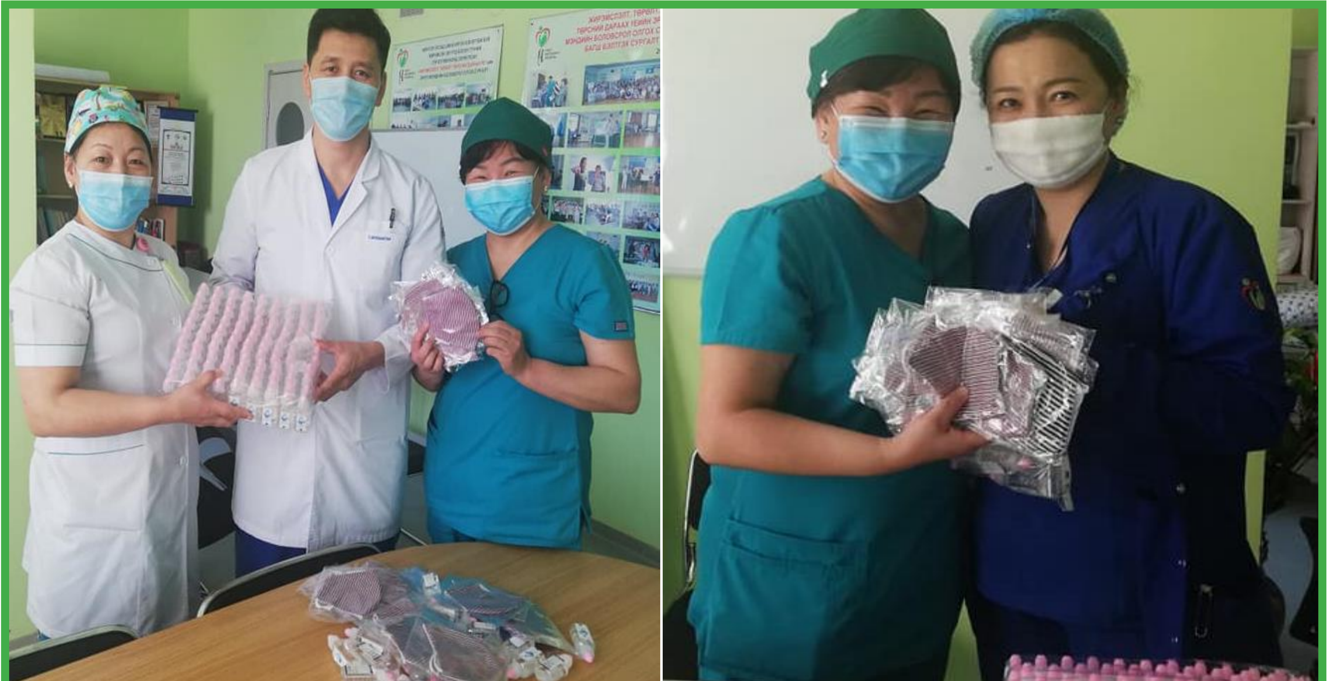
2020.03 сар - Гар ариутгагч, маск тараасан