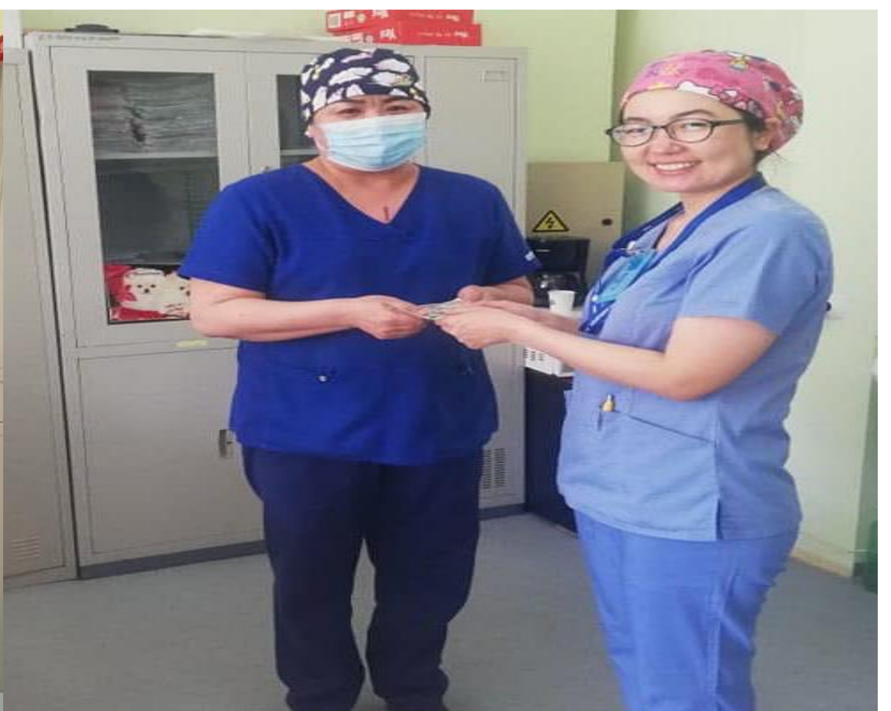
Удаан хугацаагаар өвдсөн ажилчдадаа тэтгэмж олгосон