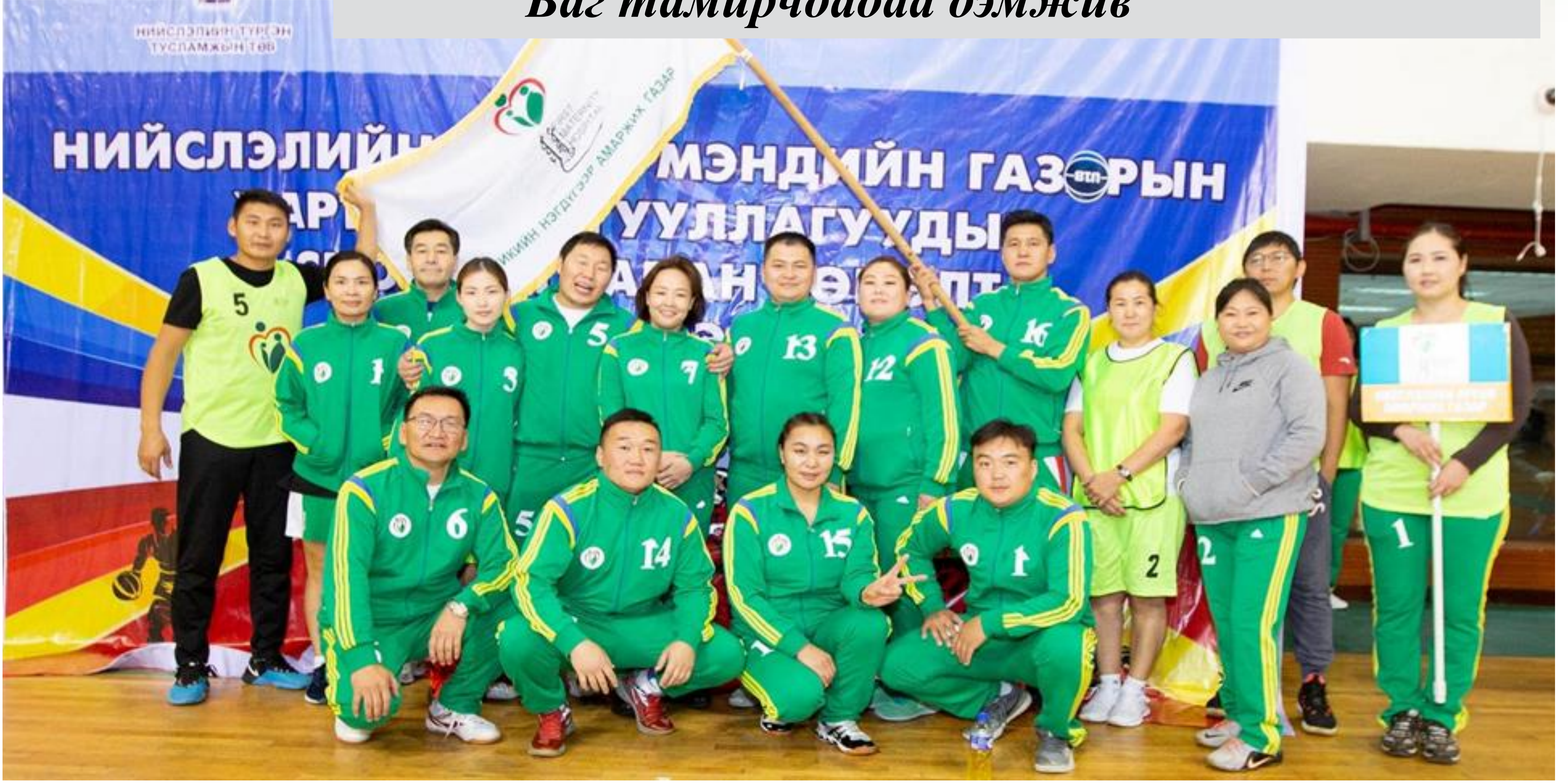
Баг тамирчдадаа дэмжив