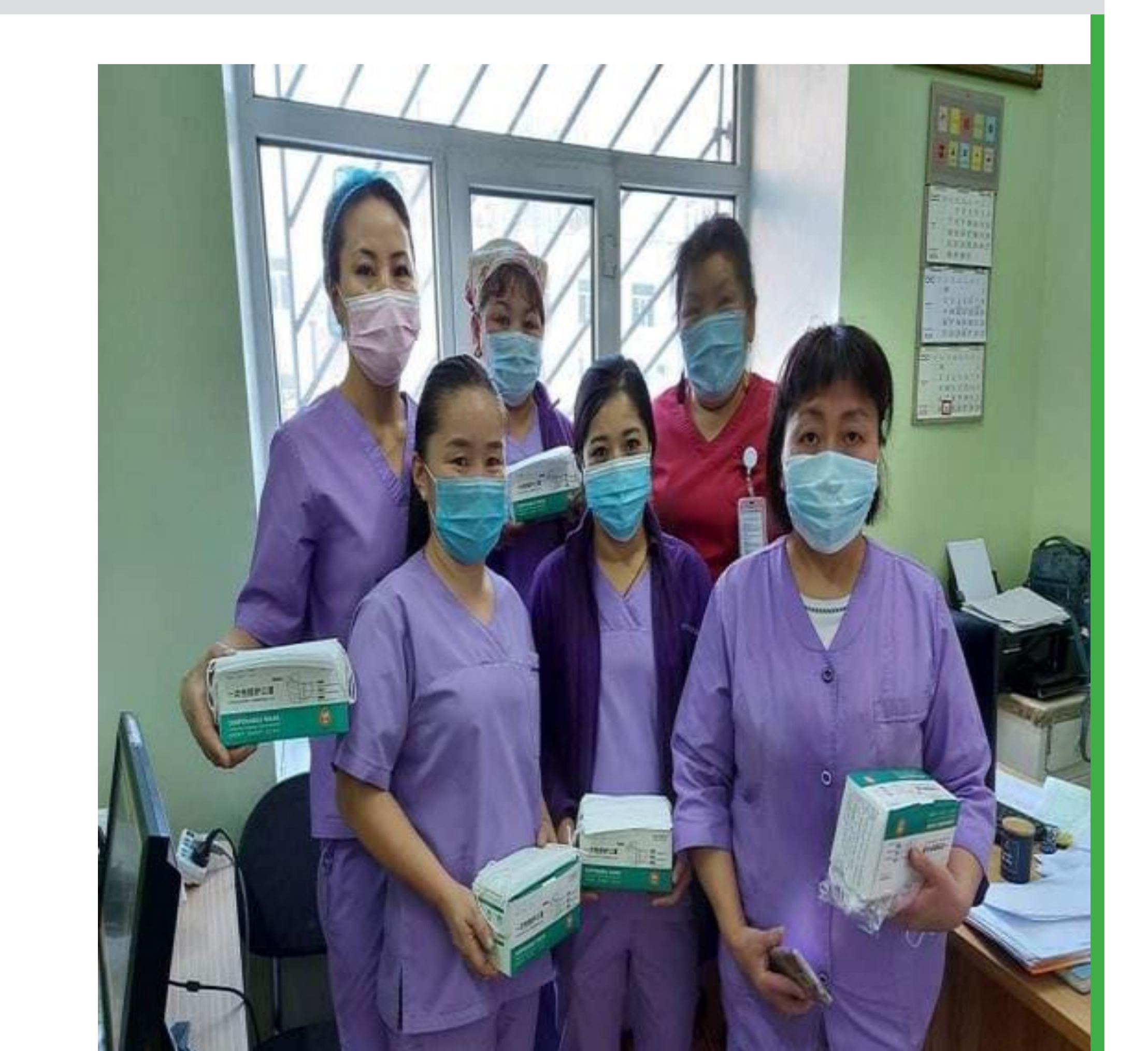
2020.11 сар Амны хаалт