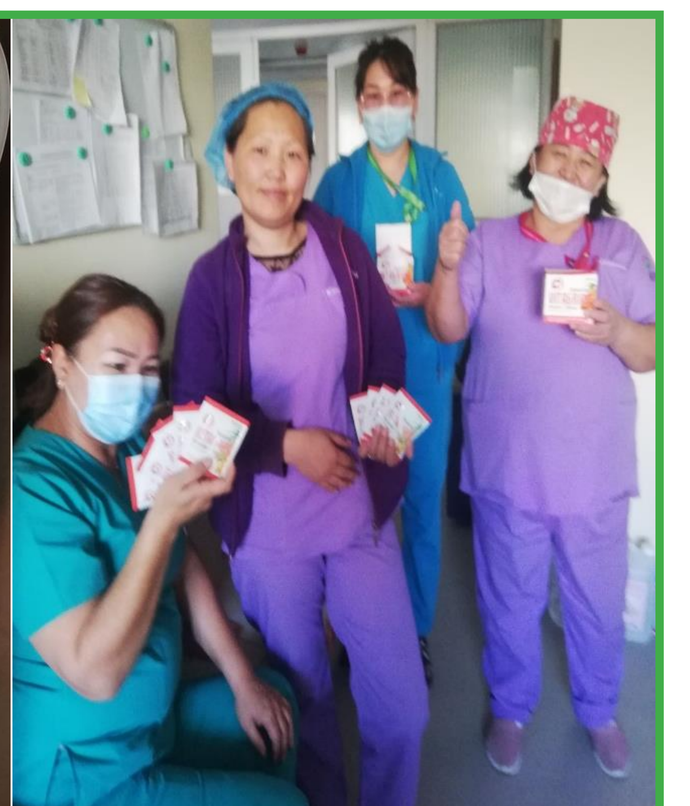
2020.11 сард Витамин С-1000 - 470 хүн - 2350ш